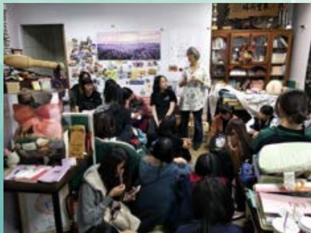
師生參訪貝斯特助產 所環境