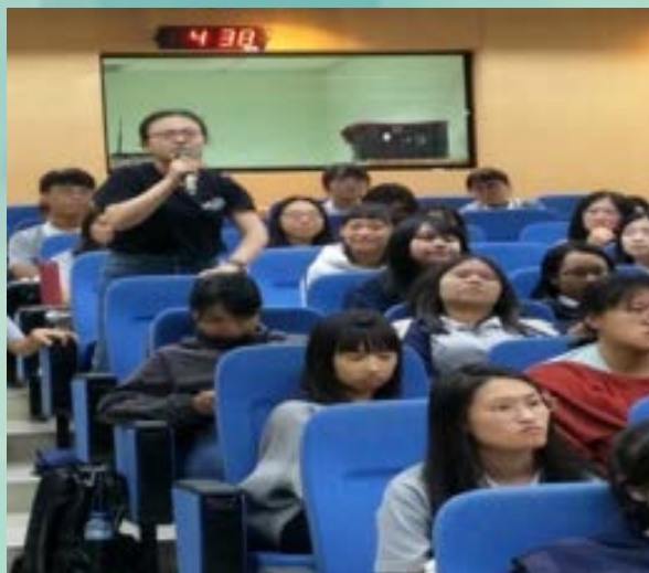
學生提問及分享心得 並與導演互動