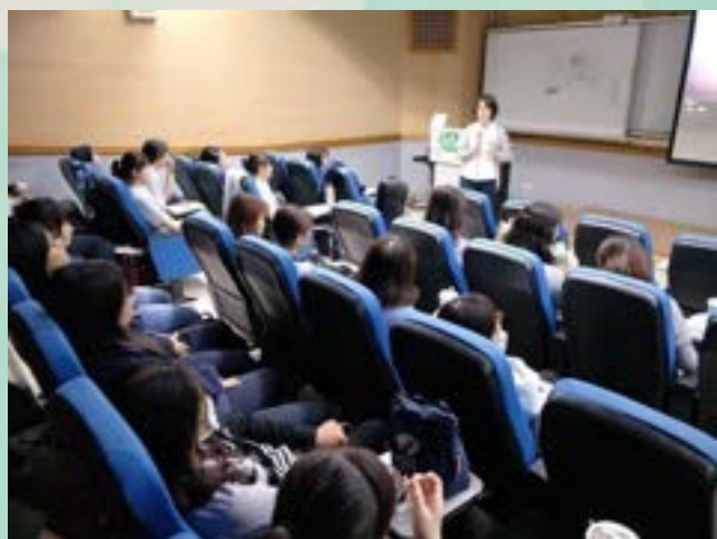
說明老師針對此次活動 期望同學學習的部分

了解溫柔生產護理(GBC)是一種替代醫療介入的生產模式，使學生明白支持孕產婦在溫馨、充滿愛的環境生產之重要性並成為訓練有素的專業護理人員。