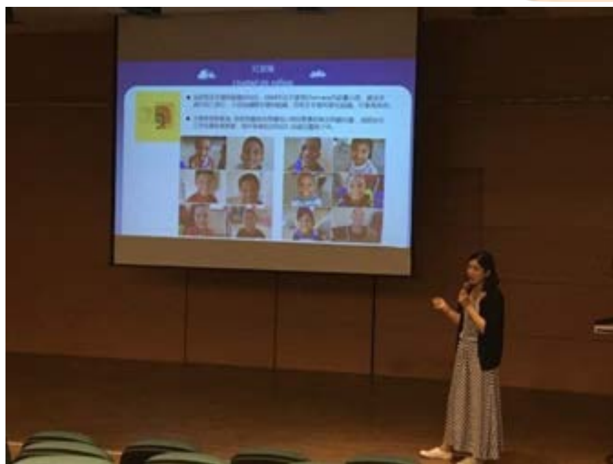
現在職涯成果展現