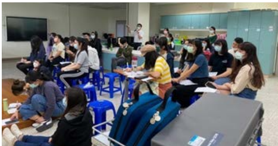
同學專心聽著兒童急救的方法