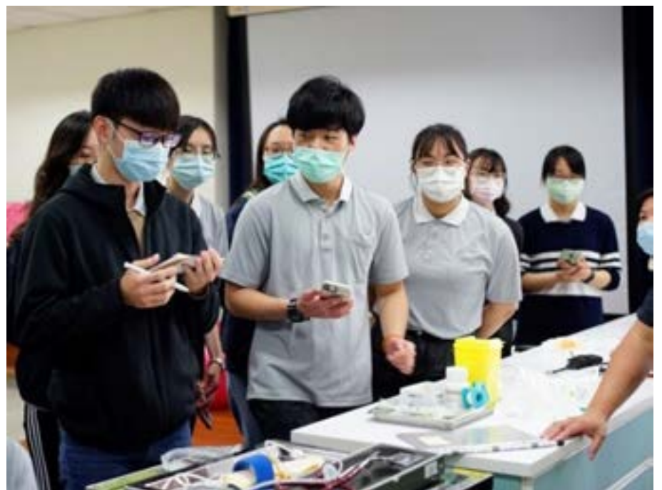
第一組學生情境模擬演練後， 觀察者同學給予回饋