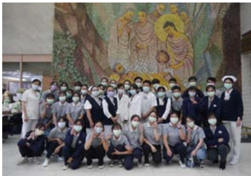
護理部主管親自迎接參訪同學

110年10月28日 上午1000-1300，進行「加護病房參訪活動」，地點為花蓮慈濟醫院內襪科加護病房，學生分成四組，安排病房對主管擔任參訪解說引導師，每組學生輪流進行加護病房參訪，活動照片及參訪心得陳述如下：