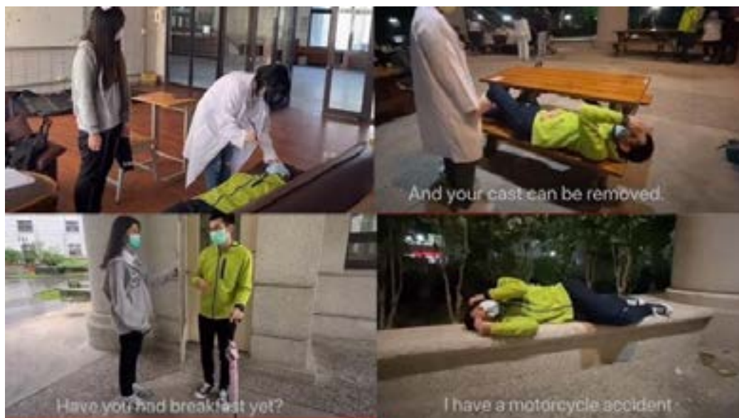
機車交通事故的復健醫療劇本演出