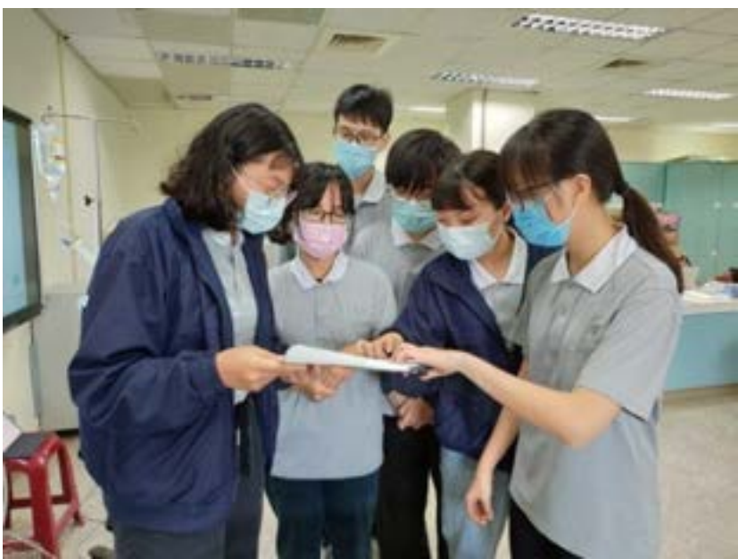
第一組演練學生 討論如何團隊合作