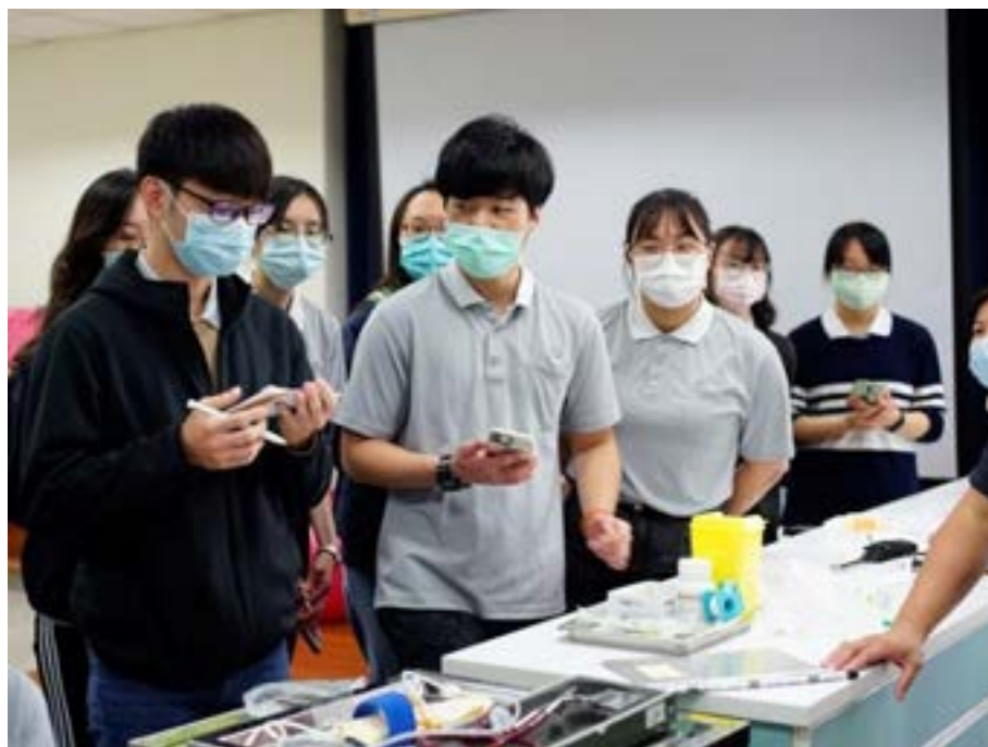
演練學生情境模擬演練後， 觀察者同學給予回饋