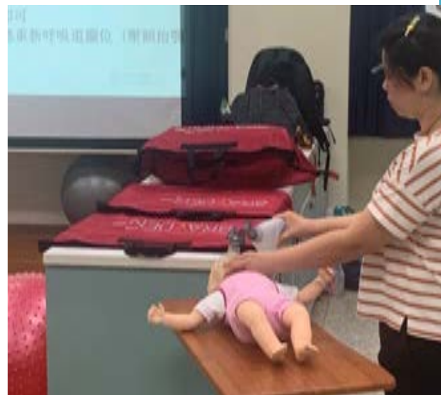
蕭醫師協助配合示範影片