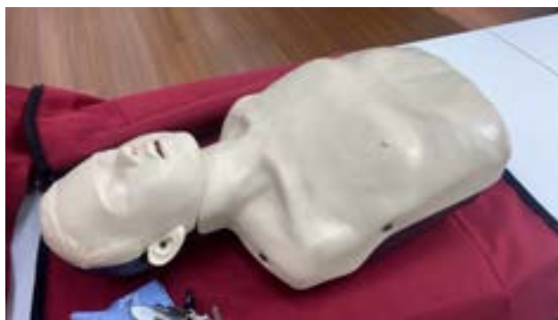
最後提醒同學，到了臨床實習時，請把握機會，練習這次未能親身體驗的兒童心肺復甦