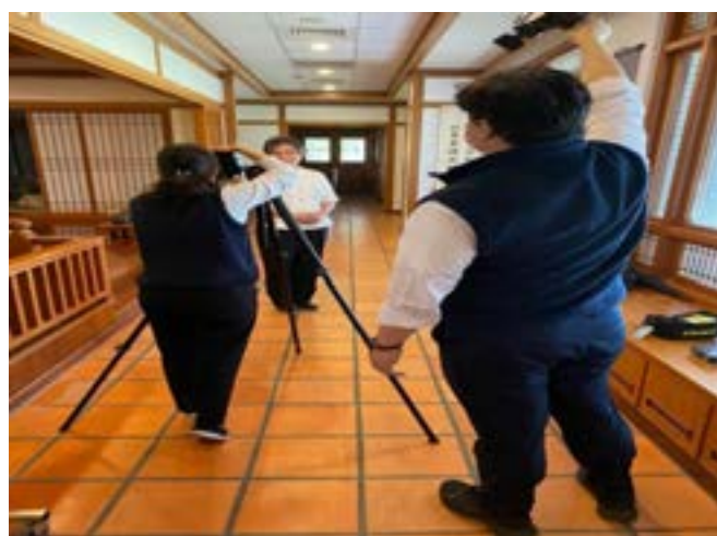
攝影人員引導老師如何擺出自然的姿勢