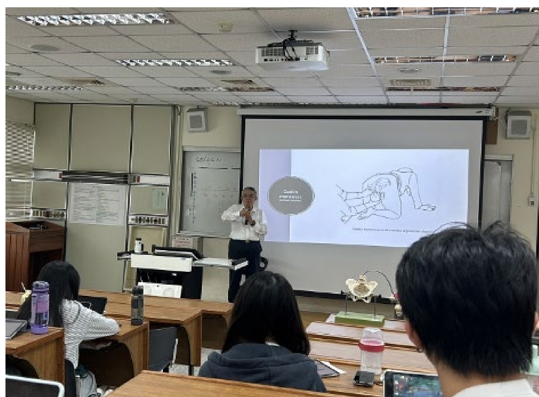
高醫師講解 檢查的方法