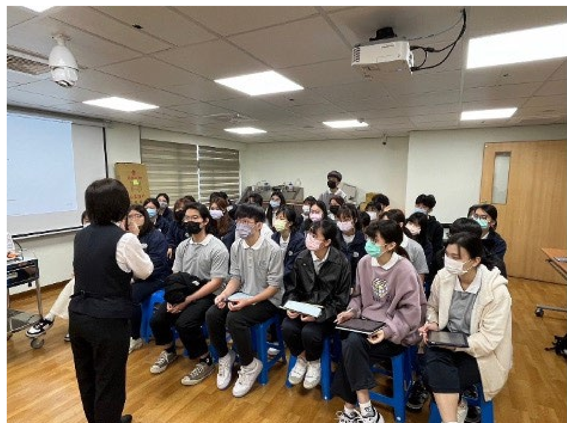
情境模擬演練後， 觀察者給予回饋