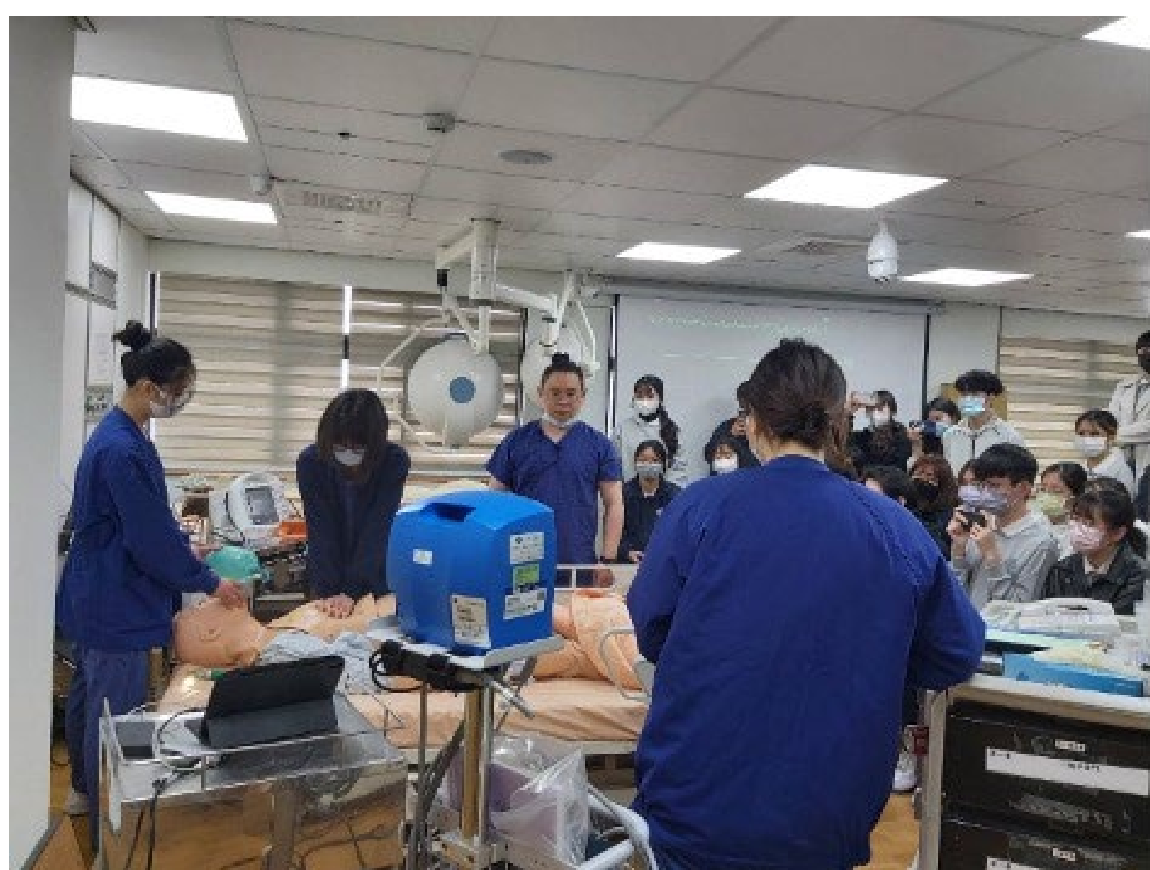
情境模擬演練後由 醫院急診學長姊示 範ACLS急救流程