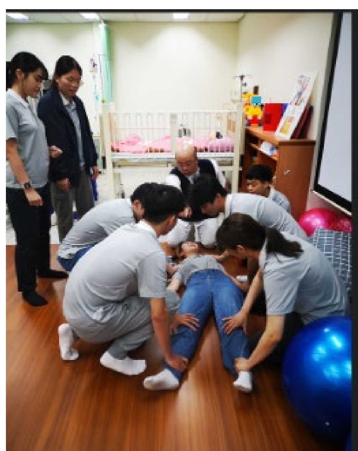
同學練習就地四肢固定約束法